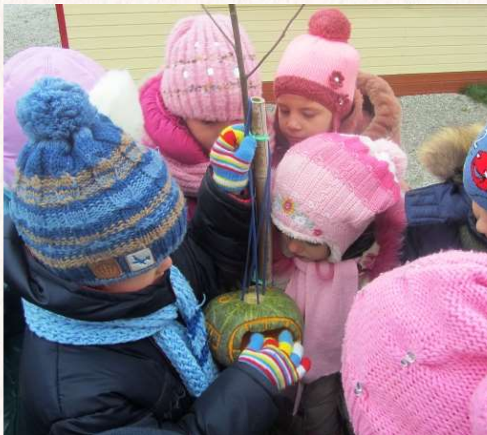
Центр «Открытая площадка»