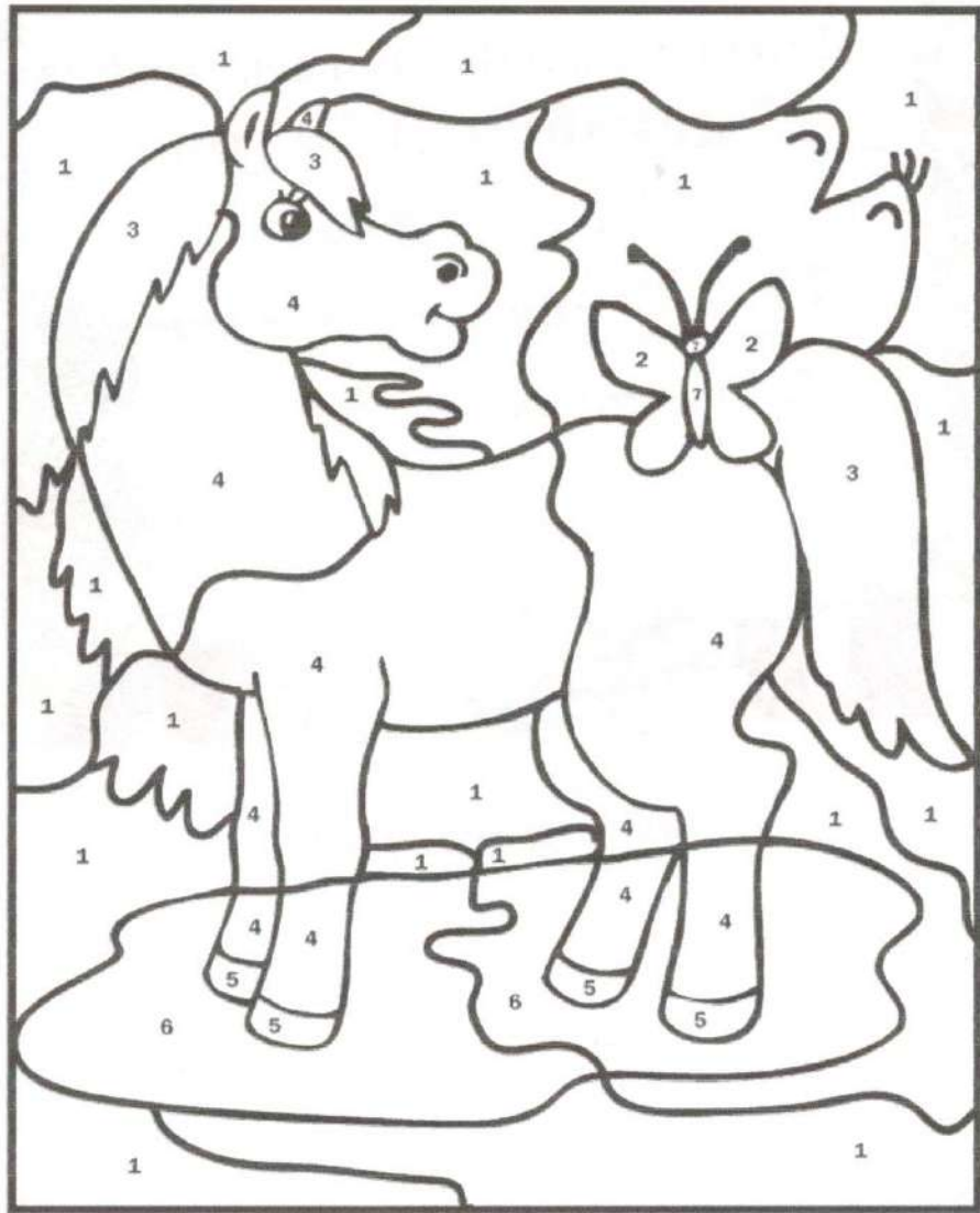
1-Голубой 2-Оранжевый 3-Чёрный 4-Светло коричневый 5-Серый 7-Красный 6-Пурпурный