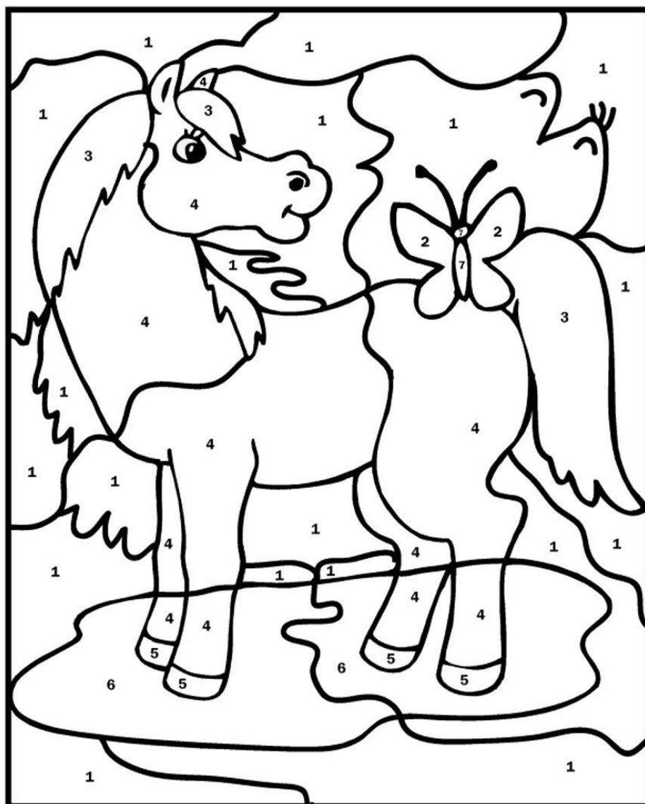
1-Голубой 2-Оранжевый 3-Чёрный 4-Светло коричневый 5-Серый 7-Красный 6-Пурпурный